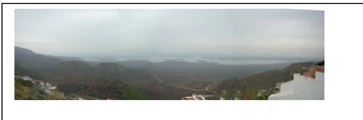
Panorámica del pantano de Guadalen desde el Castillo.